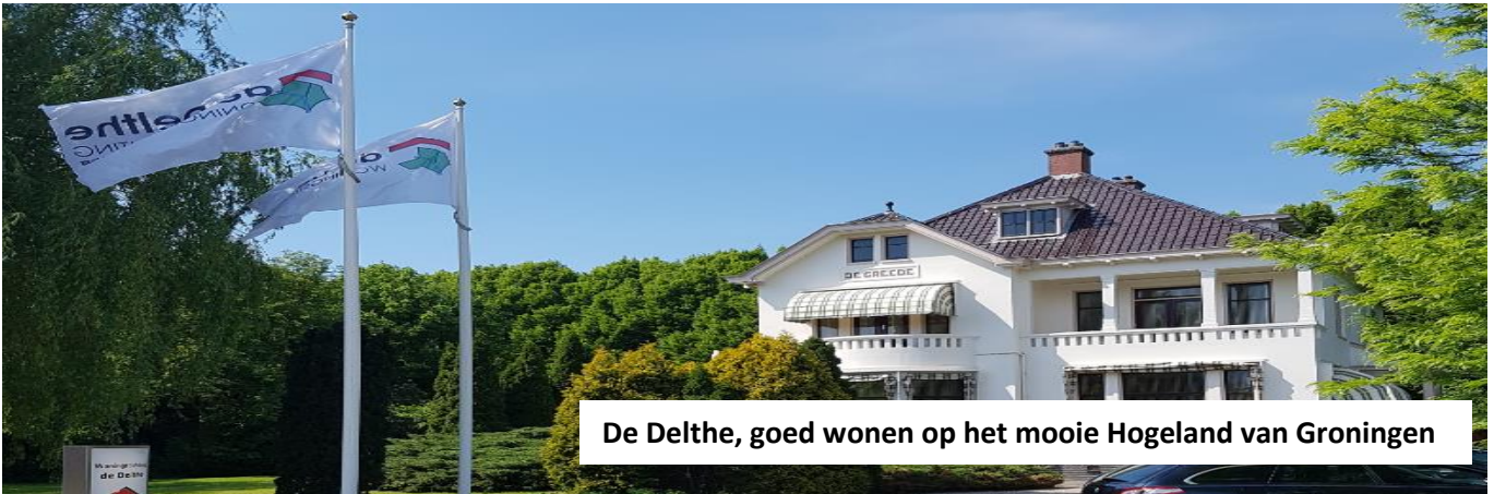
De Delthe, goed wonen op het mooie Hogeland van Groningen

Voor u ligt de Winter-Nieuwsbrief met informatie voor huurders van Woningstichting De Delthe. Hierin staat in het kort het laatste nieuws van uw verhuurder.